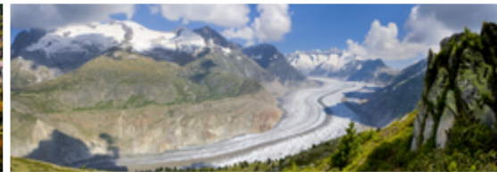
Swiss Alps Jungfrau-Aletsch

Lieu: Vieille ville de Berne Activité: Journée portes ouvertes