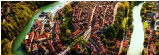
Vieille ville de Berne

Lieu: Vieille ville de Berne Activité: Journée portes ouvertes