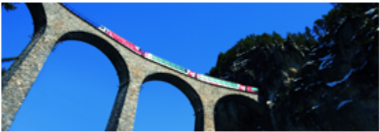
Chemin de fer rhétique Albula/Bernina

Lieu: La Chaux-de-Fonds & Le Locle Activité: Visites guidées à pied Visites en train touristique