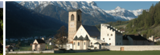
Couvent Saint-Jean à Müstair

Lieu: World Nature Forum à Naters Activité: Entrée à moitié prix au World Nature Forum / Visites guidées gratuites du World Nature Forum Déjeuner avec produits locaux