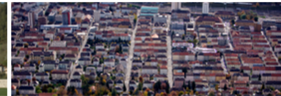
La Chaux-de-Fonds / Le Locle, urbanisme horloger

Lieu: Couvent à Müstair Activité: Visites guidées des endroits restaurés et du musée Marché de Biosfera avec des produits locaux et concert