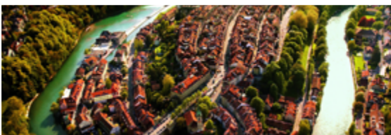
Centro storico di Berna