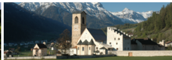
Monastero San Giovanni a Müstair

Cosa: Entrata metà prezzo al World Nature Forum di Naters Visite guidate gratuite