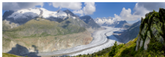
Swiss Alps Jungfrau-Aletsch