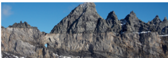
Arena tettonica svizzera Sardona

Cosa: Entrata gratuita e visite guidate del Museo ferroviario Albula Visite guidate gratuite attraverso il cantiere del tunnel Albula a Preda