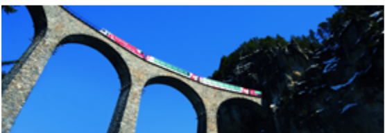
Ferrovia retica Albula / Bernina

Cosa: Visite guidate delle città Giro turistico con il trenino